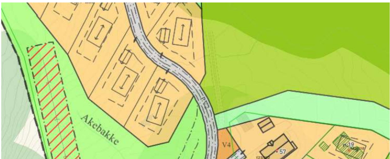
Figur 3 - gjeldande regulering, tilgang skianlegg mørkegrønt areal

Ved område H8 i reguleringsplanen ligg ei område avsett til akebakke. Ved omlegging av veg, nedgraving av høgspont og fleire tomter, går dette arealet ut. I utgangspunktet bør ein søkje å erstatte areal til born. I dette tilfellet ser me det likevel annleis, då området ikring ligg veldig godt tilrette for born og unge sin aktivitet: Rett vest for tomtene ligg store, unyttta LNF-område som kan brukast til leik og friluftsliv.