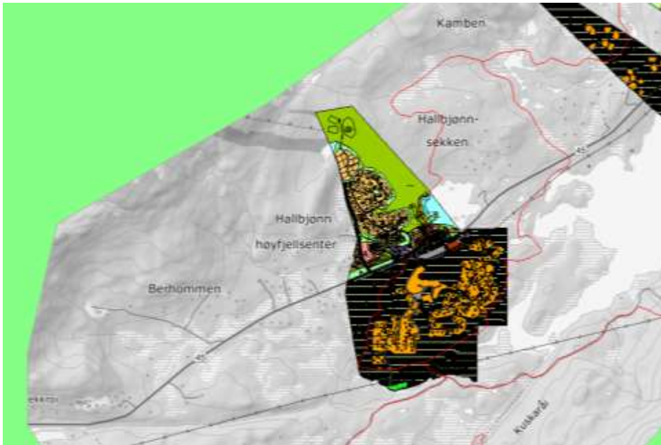
Figur 2 - Gjeldande reguleringsplanar saman med løypenett